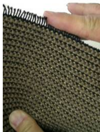
④の表面からの作業図