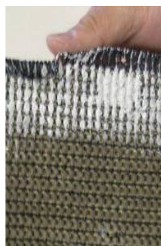
④の裏面からの作業図